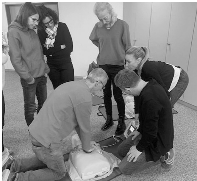
Erste-Hilfe-Auffrischung für Mitarbeitende von Pfarrei und Monséjour

Aus – leider – aktuellem Anlass möchte ich das Thema Sicherheit und Brandschutz ansprechen. Wir alle haben die erschütternden Bilder aus der Silvesternacht von Crans-Montana im Gedächtnis. Die Betriebsleitung hat nach diesem Unglück das Amt für Militär, Feuer- und Zivilschutz kontaktiert. Die kantonalen Experten haben kürzlich hier vor Ort die Brandschutzmassnahmen und die weiteren sicherheitsrelevanten Anlagen und Installationen überprüft. Bereits vor dieser Prüfung haben wir unsere Brandschutzanlage laufend modernisiert. Wir werden die empfohlenen baulichen und organisatorischen Massnahmen nun laufend umsetzen, damit unsere Besucherinnen und Besucher so gut wie irgend möglich vor solch katastrophalen Ereignissen geschützt sind. Zusätzlich haben wir im Januar 2026 erneut einen Nothelfer-Auffrischkurs für die Mitarbeitenden von Pfarrei und Monséjour durchgeführt, um im Notfall schnell und sicher erste Hilfe leisten zu können.