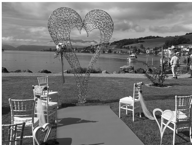
Der Herzplatz am See ist bereit für eine Hochzeitsfeier.

Die Zahl der durchgeführten Anlässe bewegt sich mit 450 verschiedensten Events im Rahmen der Vorjahre. Wir konnten beispielsweise Generalversammlungen, Konzert-, Theater- und Tanzaufführungen, private und geschäftliche Bankette, Hochzeitsfeiern und natürlich auch Anlässe des Bezirks und der Pfarrei durchführen. Daraus resultierte mit rund 8100 geleisteten Arbeitsstunden ein Gastronomie- und Mietumsatz von über Fr. 475'000.00.