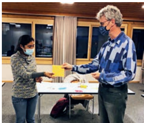
Übergabe vom Katechese-Diplom

zung des Katechetenteams herzlich gratuliert und ihr Diplom entsprechend gewürdigt. Es steckt sehr viel Arbeit dahinter!