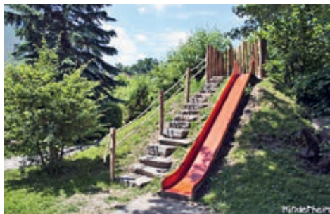
Rutsche im Garten vom Kinderheim Titlisblick

Das Haus bietet Kindern Lebensraum, die nicht oder vorübergehend nicht mehr im eigenen Zuhause leben können. Gemeinsam mit den Erziehungsberechtigten wird für jedes Kind nach einer guten Anschlusslösung gesucht, denn das Heim soll kein Zuhause für immer sein.